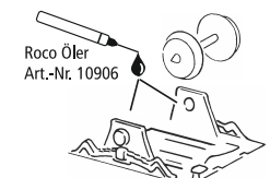
Roco Öl Art.-Nr. 10906

Ca. alle 30 Betriebsstunden! • I.e. after it has been in operation for 30 hours! • Environ tous les 30 heures d'exploitation! • Na elke 30 diensturen!